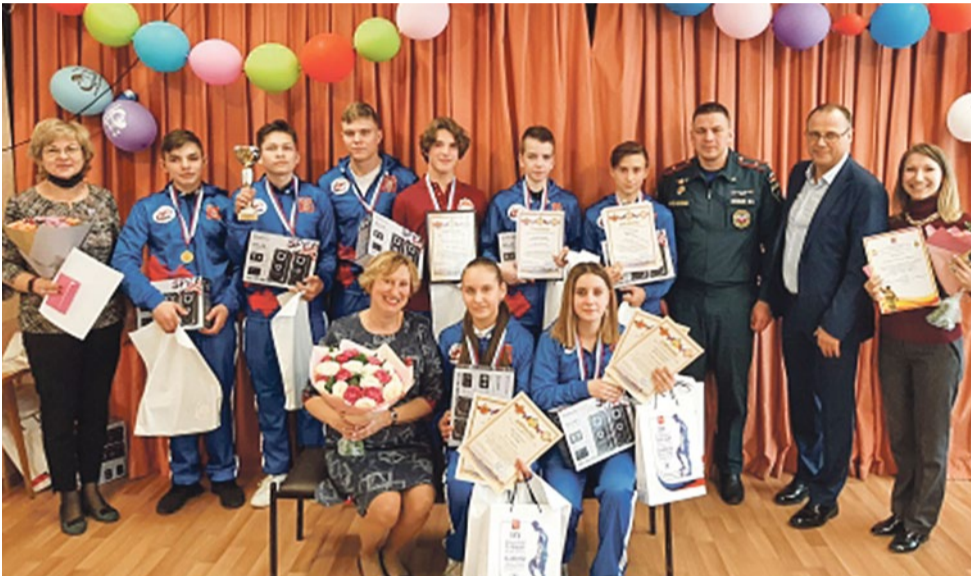
Школа № 296 принимает участие в городских, районных и всероссийских соревнованиях

В апреле 2022 года школа № 296 Фрунзенского района отмечает свой 55-летний юбилей. Это праздник для всех, кто когда-то были здесь учениками, учителями или же родителями обучавшихся ребят. И особенно это событие важно для тех, кто учится и работает в школе сейчас.