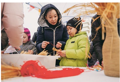
Зона мастер-классов на празднике весны