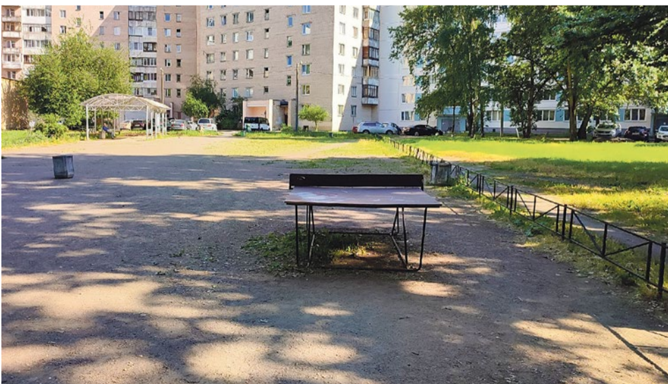
Детская площадка на Софийской улице, 55