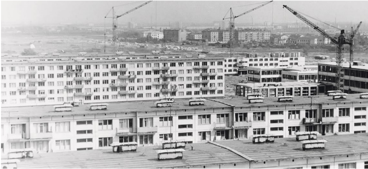
Хрущевки серии 1Лг-502. Дома 40/3 и 40/4 по проспекту Славы, дома 37/1 и 37/2 по Пражской улице. 1966 год

«Я живу в хрущевке 502-й серии» – так могут сказать про себя многие купчинцы. За этими простыми словами кроется занимательная история проектирования и строительства первых панельных 5-этажных домов нашего района.