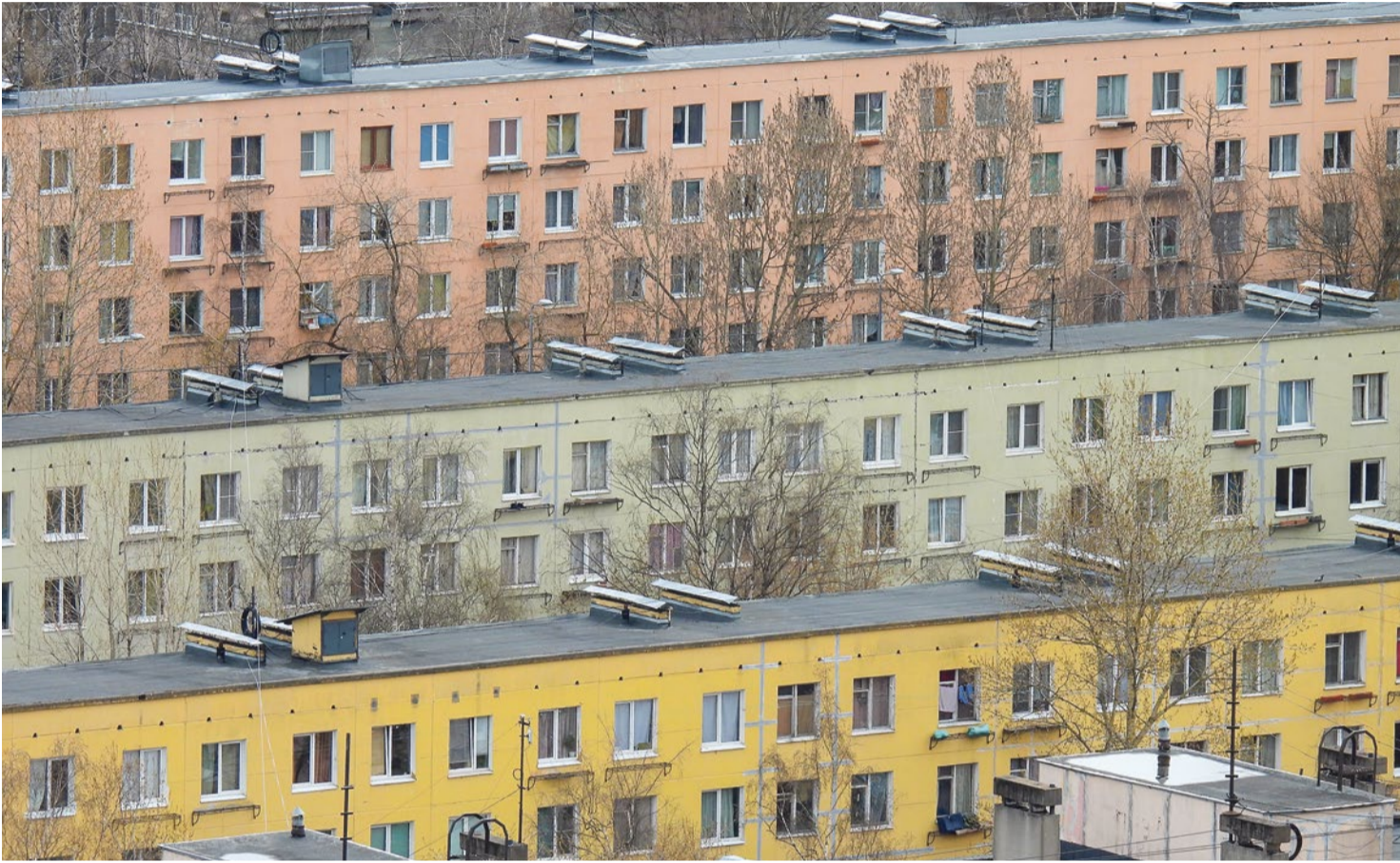
Хрущевки серии ГИ на улице Турку. Дома 8/3, 8/4 и 10/2.