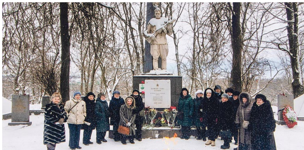
Традиционная поездка к памятнику Неизвестному солдату в Красном Селе

«Надо отдать должное нашим людям, которые в таком возрасте, с палочка-