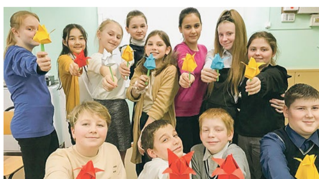
Цветы ко Дню 8 Марта