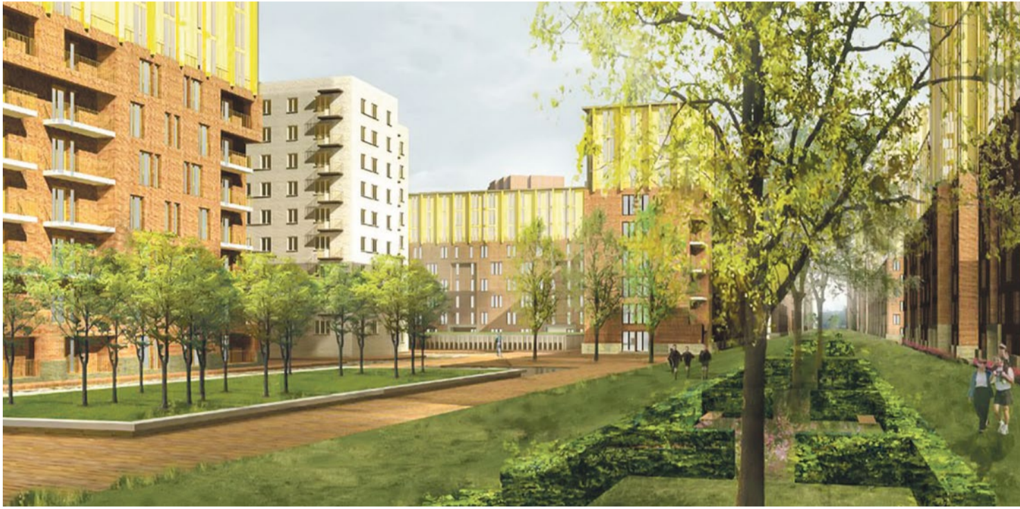
Визуализация реконструируемых дворов

Слово «реновация» звучит красиво, а шанс переселиться в новый дом на месте ветхого очень привлекателен. Однако в Купчине реальность оказалась весьма далека от ожиданий и совсем не похожа на идиллию с рекламных картинок.