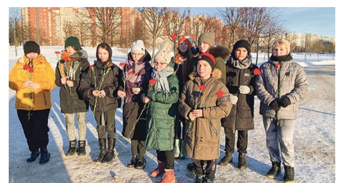
Акция «Гвоздика памяти»