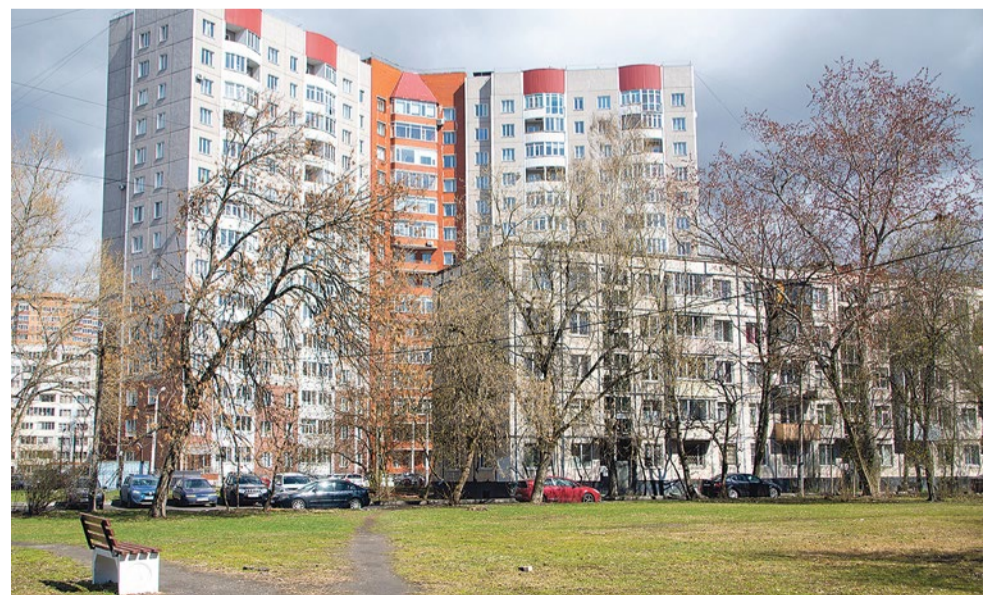
Дворы квартала Реновации