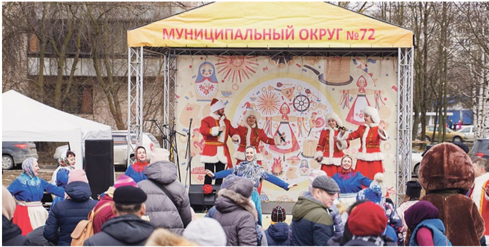
Купчинцы пробуют себя в танцах и музыке

В лабиринте домов на небольшой площадке у дома № 25 по Пражской улице жители муниципалитета № 72 2 апреля собрались вместе, чтобы отметить возвращение весны. Мастер-класс по сборке скворечника, знакомство с дружелюбным пони, звонкие песни и зажигательные танцы – в атмосферу праздника погрузились и дети, и взрослые.