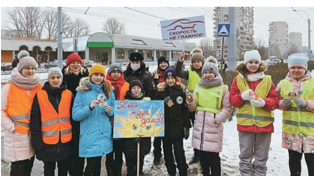
Акция «Скорость не главное»

Хочется пожелать всем причастным к школе № 296 неиссякаемой энергии, оптимизма, упорства в достижении целей и уверенности в завтрашнем дне. Школе – процветания и новых славных страниц в истории, коллективу – успешного творчества, а ученикам – блестящих перспектив. С Юбилеем!